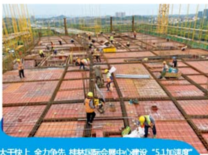
大干快上 全力争先 桂林国际会展中心建设“5.1加速度”