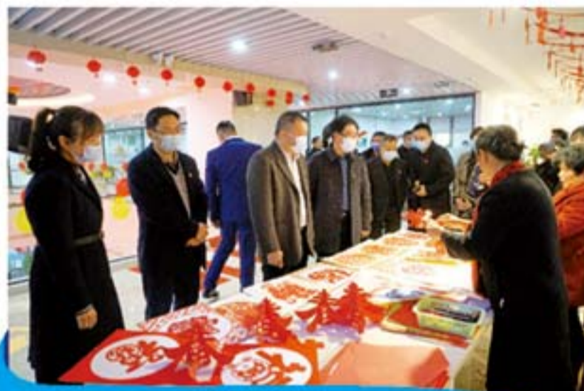
党群连心 共迎新春