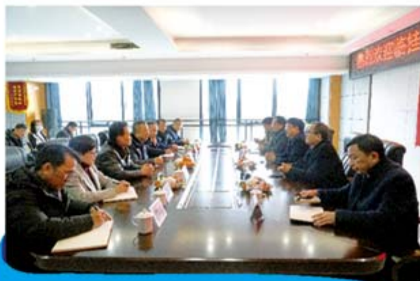
临桂新区管委会领导到集团开展新春慰问座谈