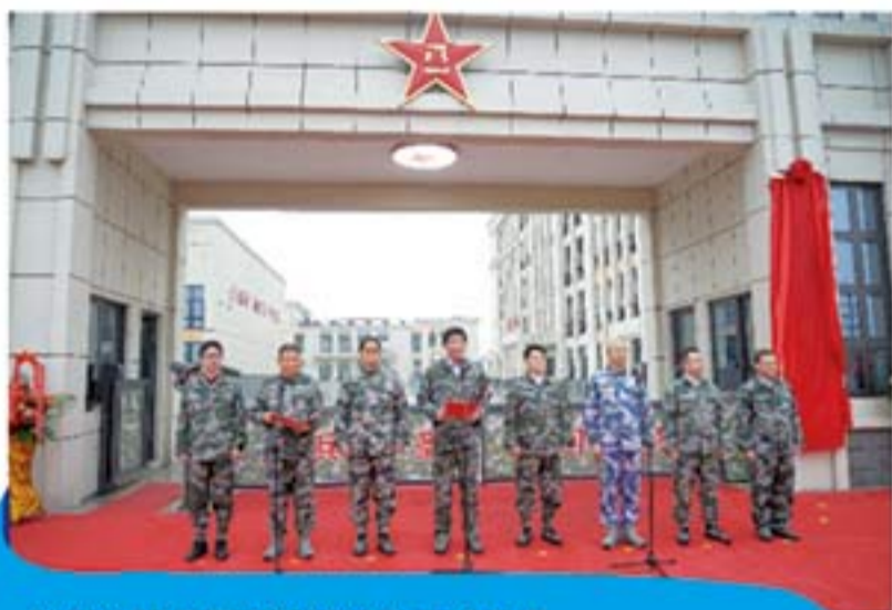
桂林市民兵军事训练基地正式启用